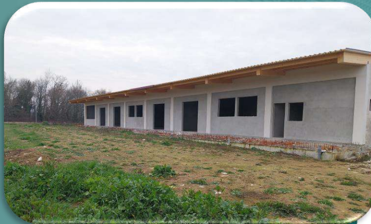
Ίδρυση οينوποιείου - αποστακτηρίου