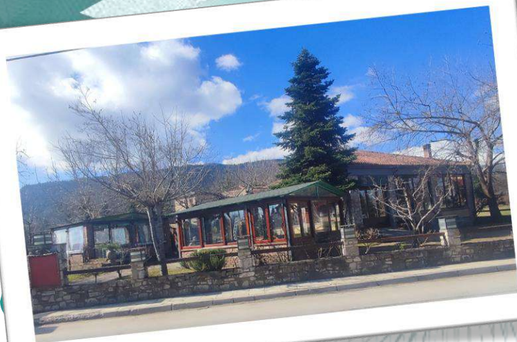
Ποιοτικός εκσυγχρονισμός εστιατορίου