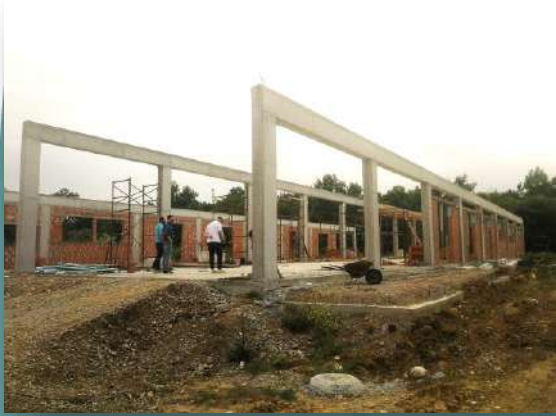
Ίδρυση οινοποιείου - αποστακτηρίου στη Μητρόπολη